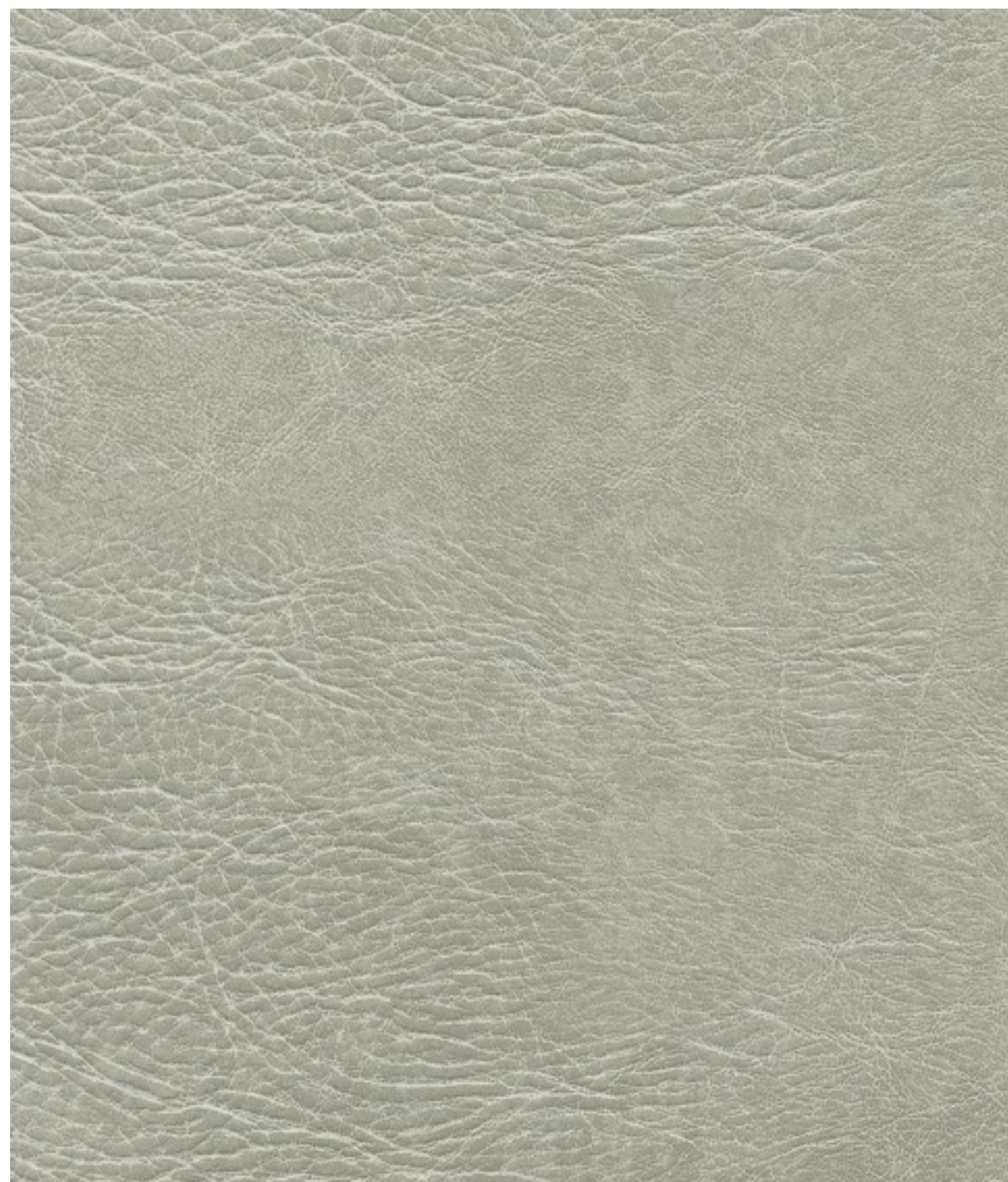
skai® Pavinto lightgrey F6411233

El producto para tapizado de alta calidad skai® Pavinto está dotado de una estética de cuero vacuno que imita los roces de un uso intenso. Sus roturas y desgastes visuales, pero también su grano variado, contribuyen a la autenticidad de este look vintage.