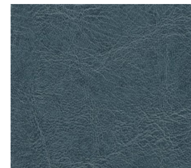
sea blue F6411232